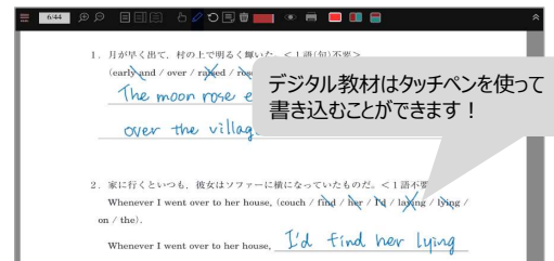
講師オリジナルプリントの配信、書き込み